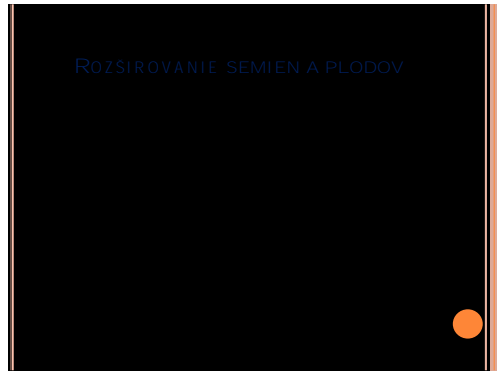
Obrázok 38 Zložen 2 plody Práve obr. vlastn a vrh