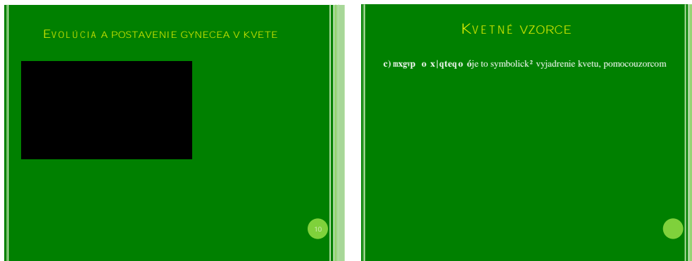
Obrázok 15 Evolúcia postavenia